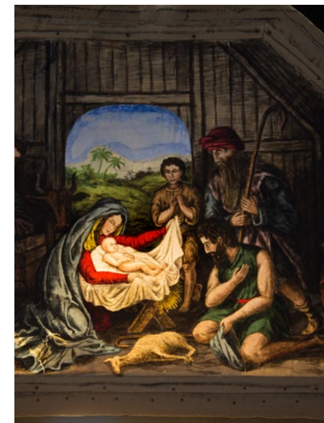
Julkrubban i Händene kyrka.

”Om Gud skapade världen vid vårdagjämningen så måste ju Jesus också ha blivit till då. För Jesus är ju början på en ny skapelse”, konstaterade han. Därmed hamnade bebådelsedagen i slutet av mars och julen nio månader senare.